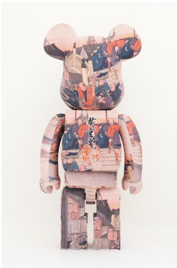
東海道五十三次_日本橋/歌川広重