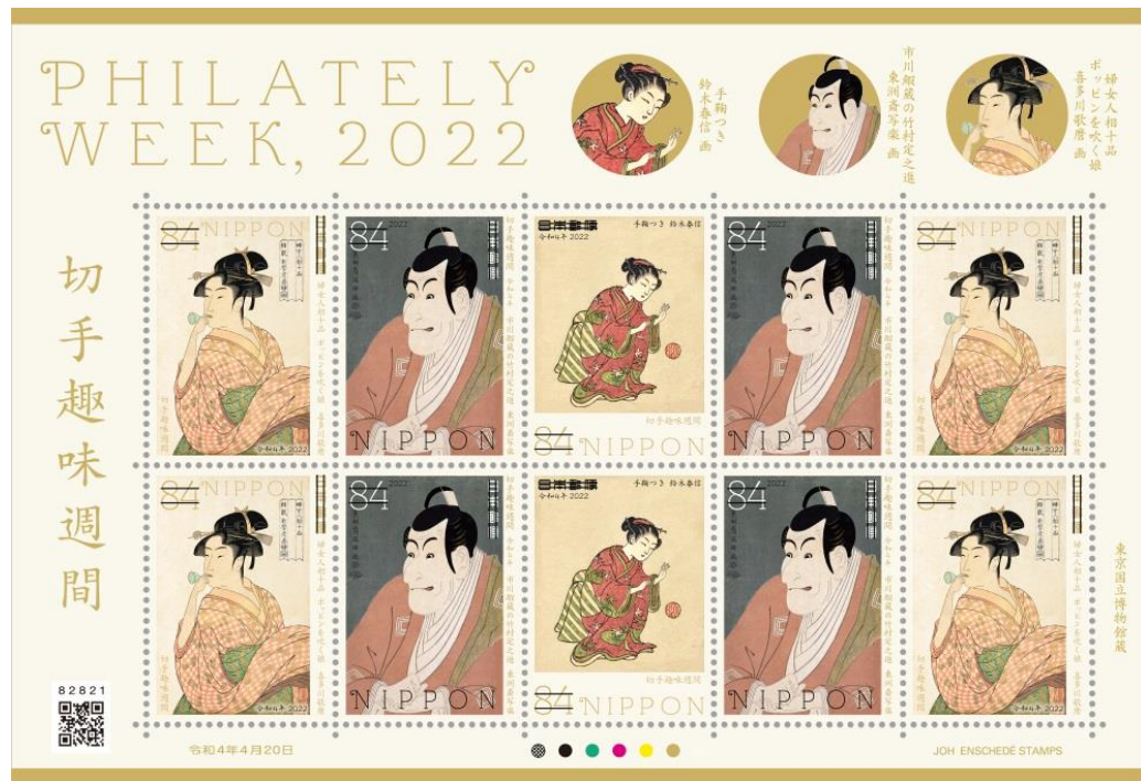
切手趣味週間 2022年4月20日発行