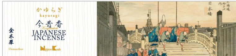
(左上から) 富嶽三十六景 神奈川沖浪裏／葛飾北斎、富嶽三十六景 凱風快晴／葛飾北斎、東海道五拾三次之内 日本橋 朝之景／歌川広重、江戸近郊八景 小金井橋夕照／歌川広重、東海道五拾三次之内 袋井 出茶屋ノ図／歌川広重、