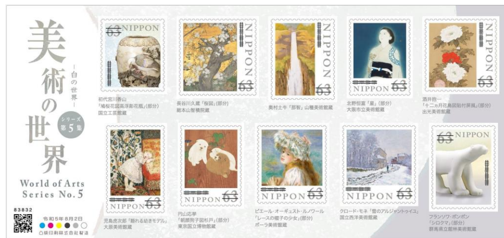
美術の世界シリーズ第5集 2023年8月2日発行