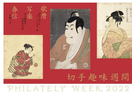
切手趣味週間 2022年4月20日発行